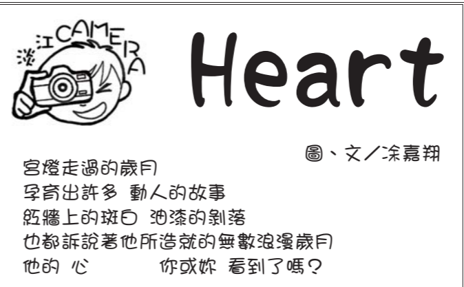
宮燈走過的歲月 孕育出許多 動人的故事 紙牆上的斑白 油漆的剝落 也都訴說著他所造就的無數浪漫歲月 他的心 你或妳 看到了嗎?