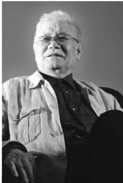
▲水墨大師李奇茂白髮齊眉、鬚髮如銀，性格豁達、樂天，但是對於繪畫始終秉持興趣、恆心與堅持，不斷超越極限、突破自我。

身為臺灣美術界泰斗，問他畫畫需不需要天份？他說：「畫畫沒什麼天份，只有努力夠不夠，畫畫要永遠秉持著興趣、恆心及堅持，三個基本原則，沒有興趣就沒有天份，沒有恆心就什麼都畫不出來，沒有堅持就永遠無法突破。」他接著說：「藝術就是生活，生活造就藝術的成長，要跟著時代走，要有新的思想，藝術不是技術，而是智慧的累積，看你如何運用智慧及生活，創造新的歷程，找出藝術的最高境界，走出個人的風格。」愛畫畫的他談到繪畫，興奮之情溢於言表，「藝術家要有豐沛的感情，將思想精神融合在藝術上，擁有內涵的作品，才最重要的。」與他對談，彷彿走進森林，享受大自然芬多精的饗宴，每一幕對話，都讓人驚豔屏息，深刻感受到他對於藝術的熱愛，及其豐碩的人生經歷。