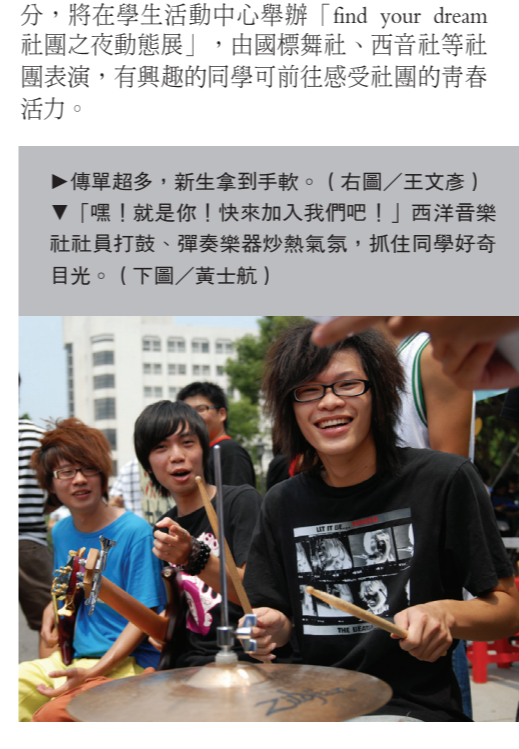
西洋音樂社社員打鼓、彈奏樂器炒熱氣氛，抓住同學好奇目光。

分，將在學生活動中心舉辦「find your dream 社團之夜動態展」，由國標舞社、西音社等社團表演，有興趣的同學可前往感受社團的青春活力。 ►傳單超多，新生拿到手軟。 ▼「嘿！就是你！快來加入我們吧！」西洋音樂社社員打鼓、彈奏樂器炒熱氣氛，抓住同學好奇目光。