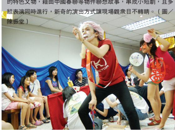
戲劇表演是研習營的重頭戲，各國學生帶來象徵國家文化的特色文物，藉由中國春聯等物件聯想故事，串成小短劇，且多組表演同時進行，新奇的演出方式讓觀眾目不暇給。

【本報訊】本報於上週六、日（6、7日）在台北校區校友會館舉辦暑期記者研習會，邀請多位知名媒體工作者前來指導，提升學生記者採訪寫作技巧，培養更精進的專業採訪技巧。 邀請的講師為壹週刊攝影記者馬立群、今周刊執行副總編輯康文炳、Cheers雜誌副總編輯盧智芳、自由時報警政組組長王瑞德，及淡江大學大眾傳播學系助理教授朱孝龍。分別講授新聞攝影、專題企劃、新聞採訪寫作，並分組實習編輯，指導版面。