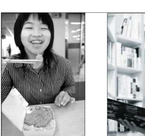
▲嘿！嘿！嘿！這就是美食廣場的人氣美食「江南咖哩豬排飯」超讚的，你也來一口吧。