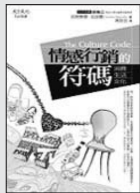
書名：情感情行銷符碼 作者：克勞泰爾·拉派爾 譯者：馮克芸 出版：天下遠見 索書號：546/8463

文化符碼是指我們透過自身成長的文化，在潛意識中賦予事物的一種意義，這可以從我們對一項熟悉產品的初次銘記（im-print）中解讀。例如，衛生紙在美國的文化符碼是「獨立」，因爲對美國家庭而言，完成如廁訓練能自行使用衛生紙，即是小孩獨立的開始。這種透過經驗及伴隨經驗而來的情緒，便創造出銘記，它會影響思考過程與未來行動。以「勾引」爲例，法國女人會巧妙裝扮、英國女人會濃妝豔抹來達到目的，義大利男人視此爲消遣娛樂，日本男人不擅此道，美國則視其爲「操弄控制」。所以，別以爲品牌全球知名就能在各國無往不利，能否正確運用文化符碼才是成功關鍵。