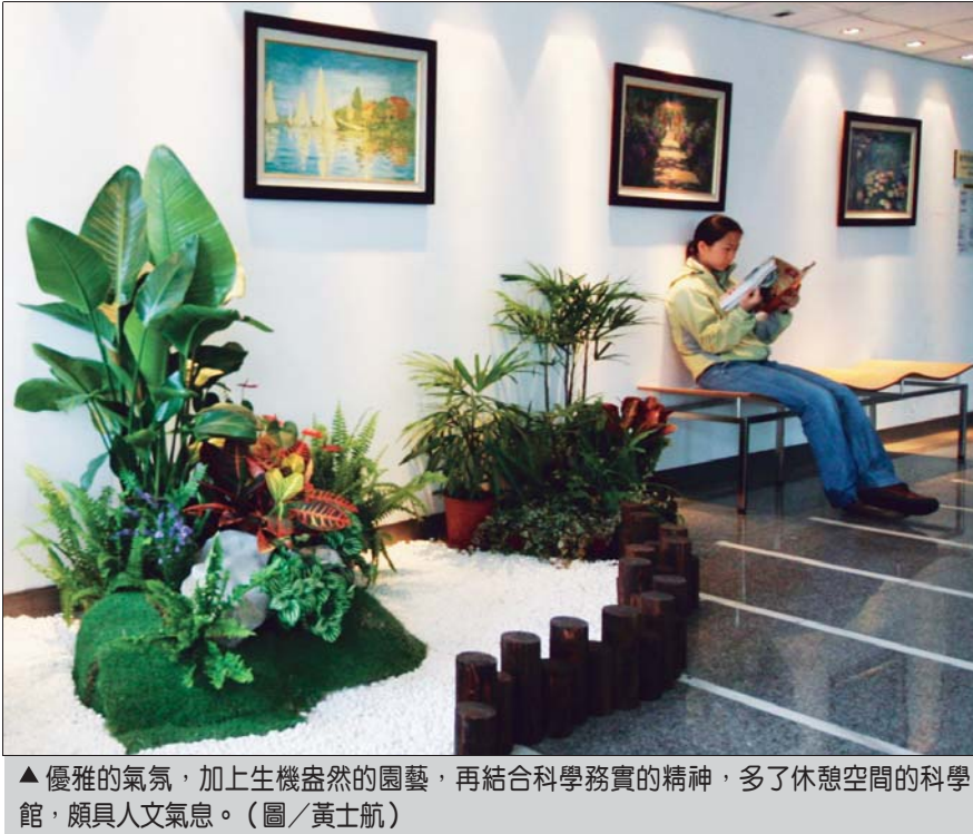
▲優雅的氣氛，加上生機盎然的園藝，再結合科學務實的精神，多了休憩空間的科學館，頗具人文氣息。