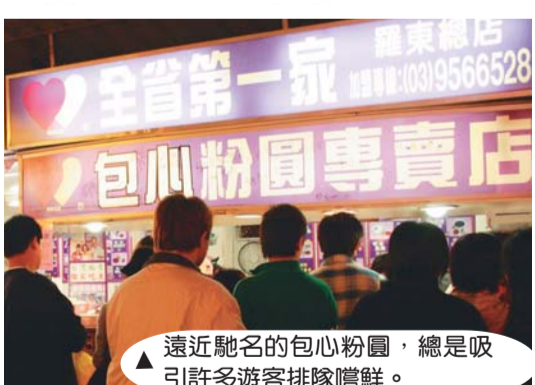
▲遠近馳名的包心粉圓，總是吸引許多遊客排隊嚐鮮。