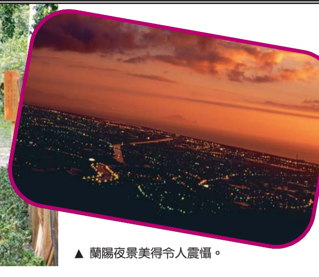
▲蘭陽夜景美得令人震攝。