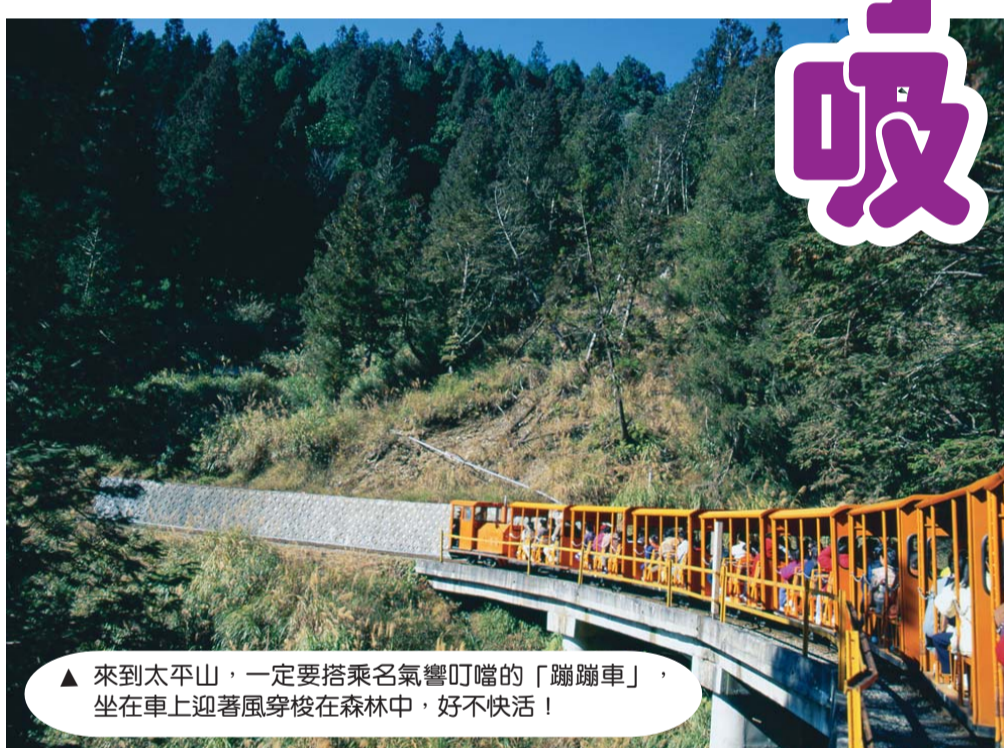
▲來到太平山，一定要搭乘名氣響叮噠的「蹦蹦車」，坐在車上迎著風穿梭在森林中，好不快活！