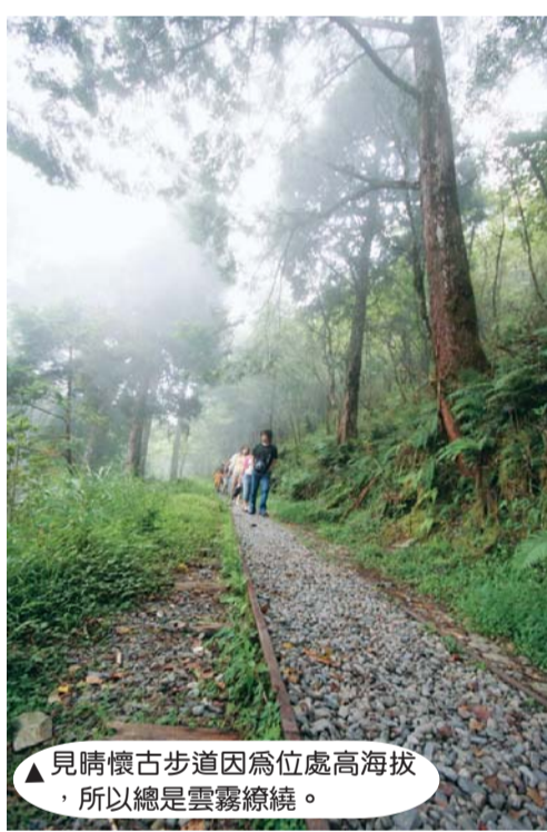
▲見晴懷古步道因為位處高海拔，所以總是雲霧繚繞。

來到太平山，當然、絕對、一定要搭乘「蹦蹦車」，否則就不算來過太平山。許多攜家帶眷的遊客，皆衝著它響叮噠的名聲而來，尤其蹦蹦車是小朋友的最愛，所以乘坐區常擠滿等候上車的人潮。蹦蹦車位於山莊旁階梯左側，車道全長3公里，行車時間約20分鐘，坐在車上，翠綠的森林畫面慢慢閃過，微風輕拂，感覺還沒坐過癮就已經到了終點站—茂興站。茂興懷舊步道上除了是一處絕佳的森林浴步道，更有各種蕨類植物的詳細解說，而且四季皆有不同的美景，所以遊客在每個季節，都可體驗到不同的景觀风貌。走入這條充盈古木老歲月風華的步道，彷彿進時光隧道裡，綿延的鐵道宛如遺世那段曾經有過的燦爛歲月。搭著最後一段折返的蹦蹦車，收穫滿滿。經過這兩天森林浴、溫泉的洗禮，身心脫胎換骨、神清氣爽，「宜蘭，下次見！」