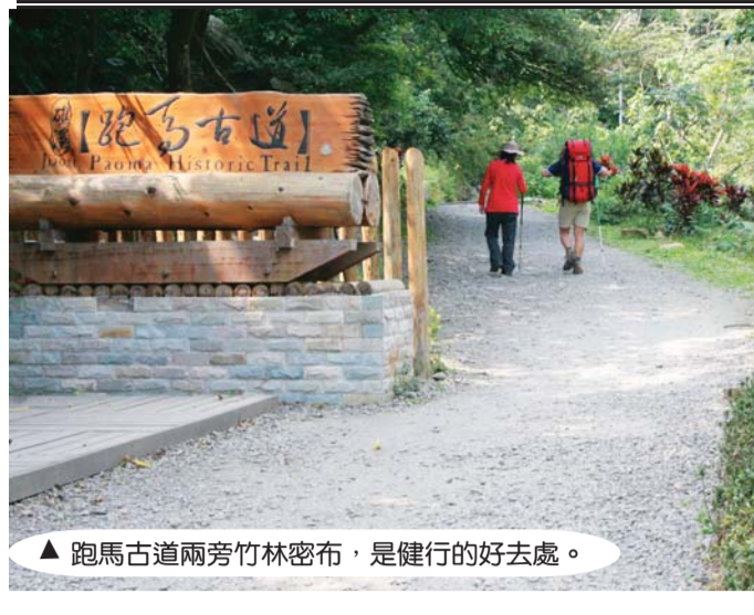
▲跑馬古道兩旁竹林密布，是健行的好去處。