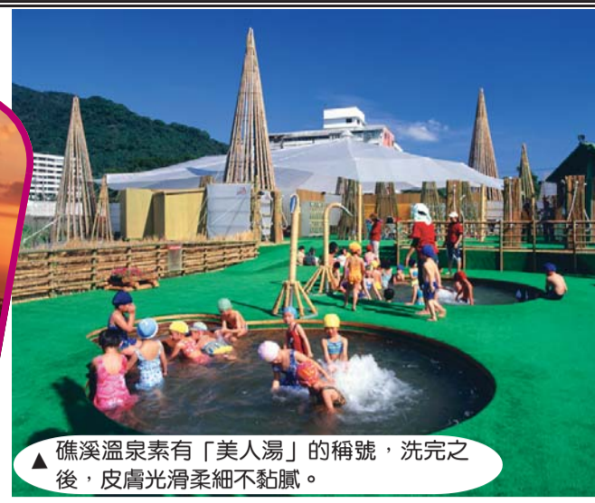
▲礁溪溫泉素有「美人湯」的稱號，洗完之後，皮膚光滑柔細不黏膩。