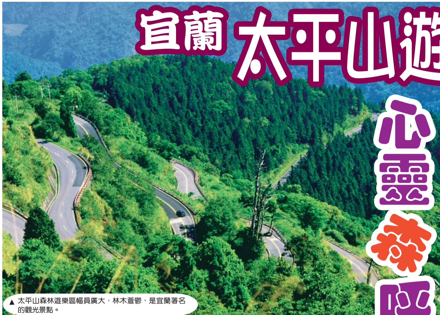
▲太平山森林遊樂區幅員廣大，林木蒼鬱，是宜蘭著名的觀光景點。