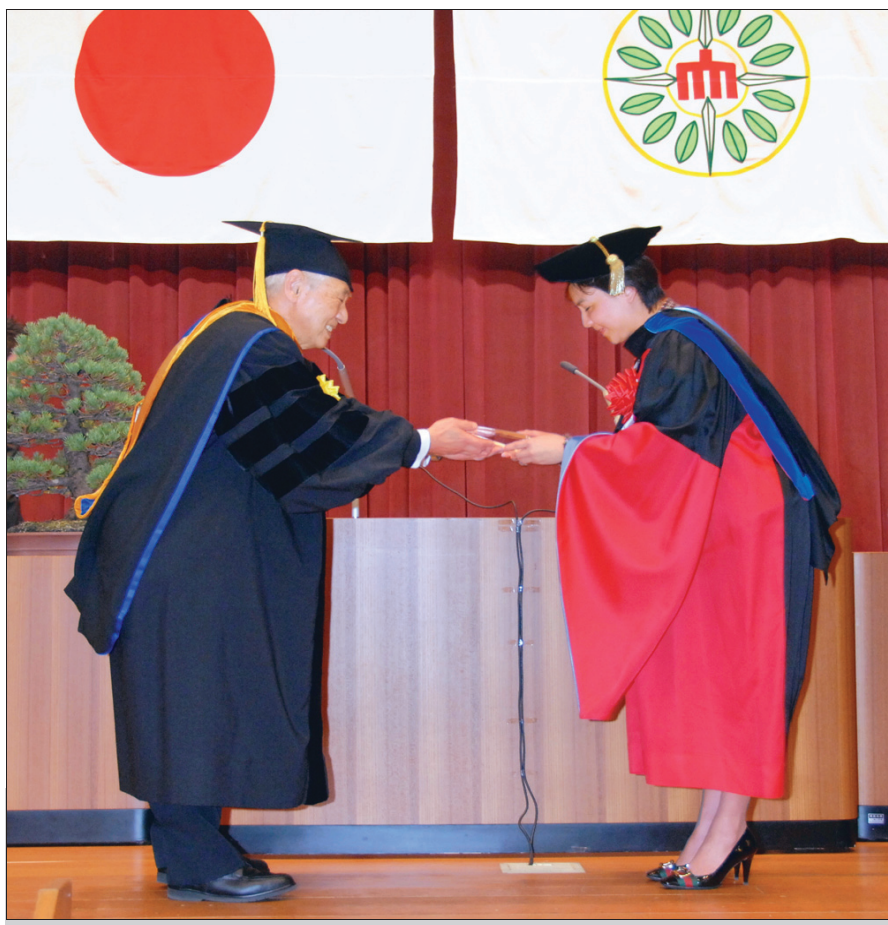
▲本校校長張家宜於3月20日在日本城西大學畢業典禮上，接受該校頒贈榮譽博士學位，以表彰張校長在國際教育研究發展上的卓越貢獻。

【記者薛瑜淡江校園報導】96學年度全品管研習會於本週三(26日)舉行，由校長張家宜主持開幕典禮，全校一、二級單位正副主管暨秘書及行政人員約650人將與會，會議分上午、下午兩梯次。教評組表示，規劃上、下午不同的主題，使研習會內容更為豐富多樣。上午專題演講邀請專家，針對本校申請國家品質獎過程進行檢討與改進的分享；下午專題演講講題為「世界大學網路排名：簡介、方法和未來發展」。