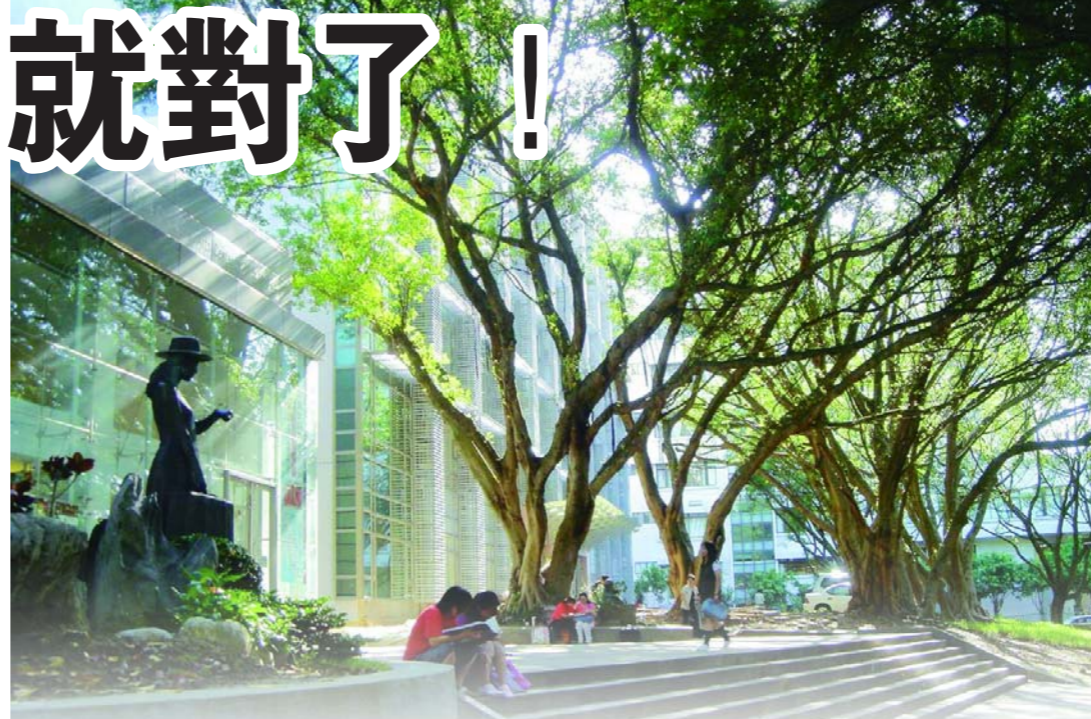
招生，開國內各大學數位學習風氣之先。

30多年前，本校就領先提倡資訊化的校園，不但首先設置資訊中心，引領趨勢，將電腦科技應用於教學、研究及行政工作上。