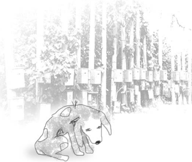
上學期曾發生同學被流浪狗追逐導致受傷事件，引發師生對校內流浪狗管理問題之不同看法。本報特別刊載師生、校友的寶貴意見，形塑共好校園。