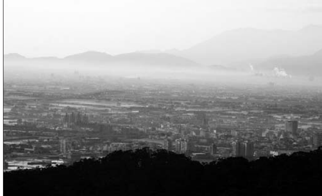
從小生長在宜蘭這塊土地上，早已習慣蘭陽的景色，但在一個充滿霧氣的早晨，由蘭陽校園鳥瞰，卻被眼前這一幕迷濛的美震撼，礁溪鄉在薄霧中逐漸甦醒，那種悸動的心情卻久久縈繞不去。