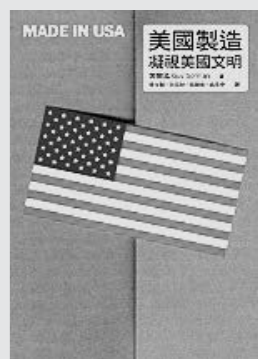
美國製造——凝視美國文明 作者 索爾曼 (Guy Sorman) 出版社 允晨文化 索書號 752.3 /8334