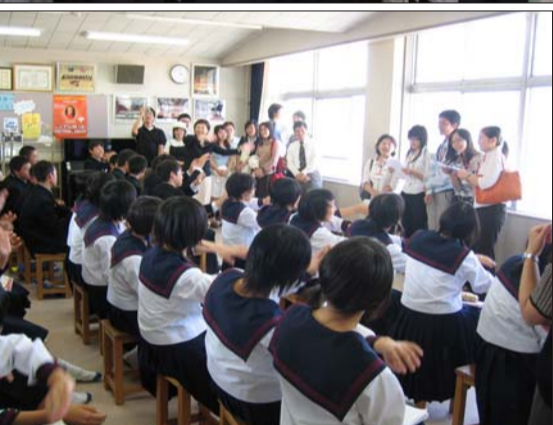
▲商、管學院同學4天都搭電車在長崎活動，見識了日本人的多樣面貌。 ▲文、教育兩學院師生訪問團赴長崎大學附屬中小學參觀。