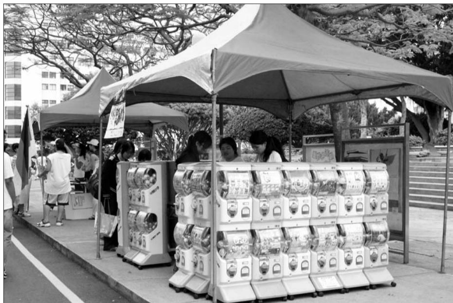
▲上週舉辦的外語週活動，日文系順應時代潮流，租來許多扭蛋機放置於海報攤，許多學生好奇圍觀，並互相討論轉下來的扭蛋。

size的置物盒，正是最適合放扭蛋的小窩。想做禮物送人時，不妨先將家中重複的扭蛋或不想要的(但別讓收禮者知道)挑出來，再依據對方的個性或喜好，挑選適合的款式，然後準備一條三秒膠，將扭蛋稍微佈置一下再黏上，既大方又獨特！若是要自用，則不需黏死，先準備一塊防塵墊(玩具店有售)黏在扭蛋下方，就可隨意更換喜愛的玩具。