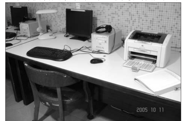
目前蘭陽新生住宿的蘭陽學園，宿舍自習室內貼心地擺置公用電腦及印表機供學生使用

蘭陽校園以英式全人教育為主，具有多項全國獨一無二的教學特色，包括：每學期分兩學季，每學季為9週；開設課程90%以英語授課，晚上並有課後輔導；未來大三學生皆將出國留學一年；沒有期中期末考，一週只上一至週四共四天，每週五早上固定舉行週考。另外，師生全體住校，營造如家一般的