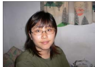
淡江時報記者 考上中興中研所、本校語教所