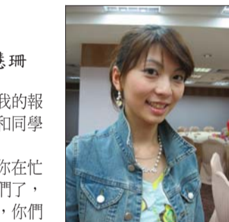
淡江時報記者 操行獎受獎人 考上本校管科所