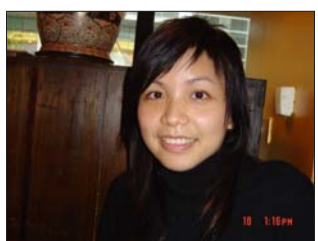
游泳校隊 學業獎、操行獎受獎人

這兩年多的訓練，我對於學業很有自信，未來我會先工作一段時間，等我在商場上有了經驗之後，會自創公司完成我的夢想。對於畢業，我很高興可以步入社會，回到家鄉，可一方面又因為要離開這塊生活了這麼久的地方而難過，未來我不知道還會不會回到這裡，但是我很感謝淡江給我的教育。Farewell, Tamkang! (記者王頌整理)