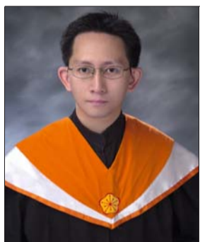
高遠網路實驗室成員

在淡江念了8年的書，印象深刻的，是種種屬於淡江校園的回憶以及這裡的人群，記憶中，是一幕幕的校園美景、人潮總是多得像電影散場的人群、漂亮的學妹以及相當優良的硬體。我常覺得，淡江其實很敢在硬體設備上花錢，或許大學生還很難感覺得到，但在研究生的立場來看，就會更深刻的感受到學校很用心辦學，也相當重視研究發展，在硬體設備與研究成果上，可謂不遺餘力。