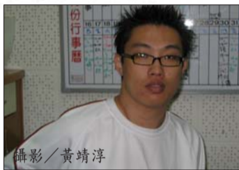
曾任學生議會議事長 曾任編譯網路廣播電台台長 張老師基金會儲訓學員 《醒來後的淚光》作者 考上本校教心所

我很感謝教過我的老師和助教，他們不厭其煩地任由我問問題，也感謝同學們的支持與相互扶持。畢業後，我會朝保險精算方面發展，我已經找到工作了，在英國保誠人壽的教育訓練部門，希望未來能有傑出的表現，爲母校爭光。(記者吳佩儀整理)