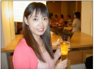
淡江時報記者 中文系學會文書長 文編藝術中心志工