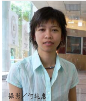
大專運動會女子乙組跳遠亞軍 100公尺跨欄第三、第四 體育獎受獎人 考上成大資工所

我是活潑好動的台南女孩，大學4年裡參加了田徑校隊以及系排球隊，運動是我生活不可或缺的一部分，要離開淡江的排球場以及可合台前的操場，心中真的很不捨，雖然有領取體育獎，是對我在校隊4年努力過的鼓勵，但同時也意味著：「大學學業已經告一段落，將要邁向下一個人生的里程了！」