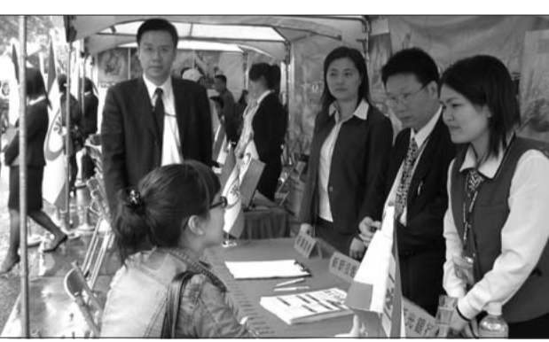
▲新光金控攤位前詢問人潮不斷，當天收到的履歷表八百封。

另外，未來進入職場後，萬一在公司有待遇等問題，原先說好的福利在進公司後並沒有兌現，那該如何解決？就輔組組長表示，就輔組可以協助同學尋求校內外適當管道解決問題。