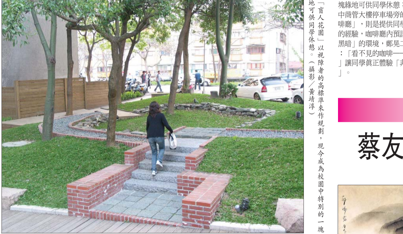
「盲人花園」以視障者的高標準來作規劃，現今成為校園中特別的一塊綠地可供同學休息。

鄭見二表示，預計在商管大樓後方停車場，延校園邊際的帶狀空間，營造出「石頭花園」及「盲人咖啡小站」的規劃，未來仍在構思中的，則為「盲人餐廳」。由於校園中需以有限土地爭取無限空間，每項規劃主要以盲生為對象，校園中可能無法作到完全無障礙，但卻以更「友善」；藉由設計一套友善空間，不只