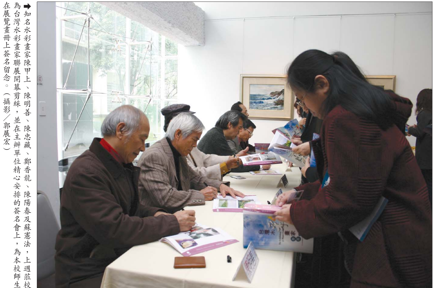
知名水彩畫家陳甲上、陳明善、陳忠藏、鄭香龍、陳陽春及蘇憲法，上週蒞校為台灣水彩畫家聯展開幕剪綵，並在主辦單位精心安排的簽名會上，為本校師生