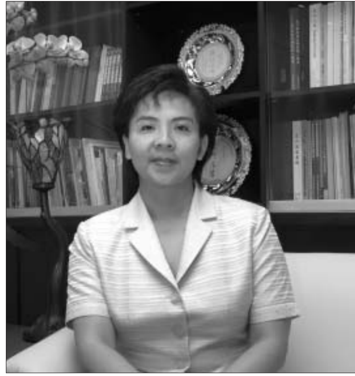
學歷：美國史丹佛大學教育行政學博士 美國史丹佛大學教育行政學碩士 美國哥倫比亞大學經濟學碩士 淡江大學經濟學系學士