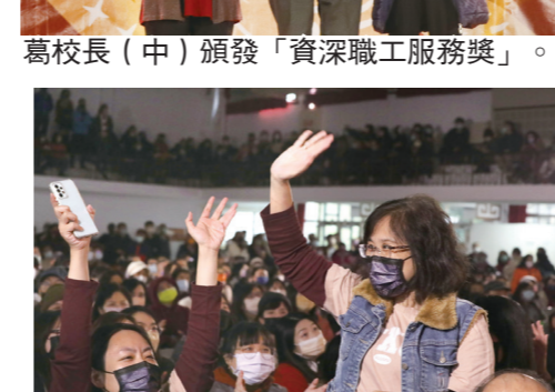
聽見自己中獎的瞬間，興奮得歡呼叫好。