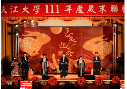
驚聲詩社吟唱表演，吸引眾人目光。