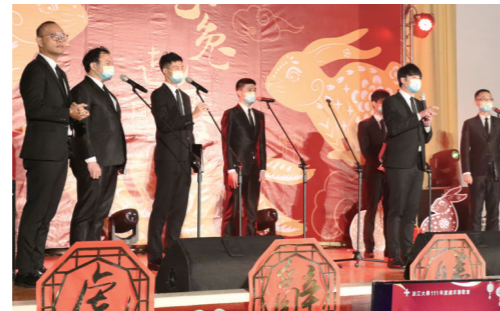
八角塔男聲合唱團的表演讓人為之驚豔。