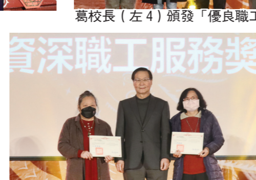
葛校長（中）頒發「資深職工服務獎」。