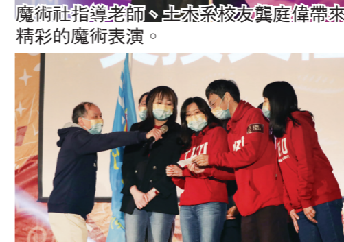
111年度歲末聯歡會由文學院團隊主辦。