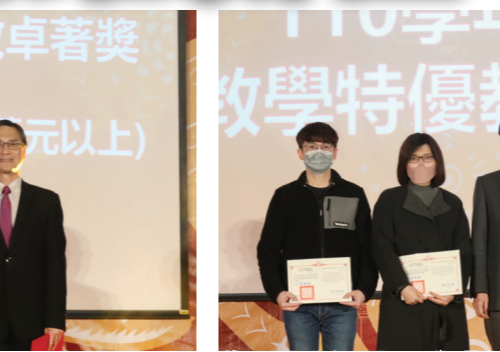
葛校長（右2）頒發「教學特優教師獎」。