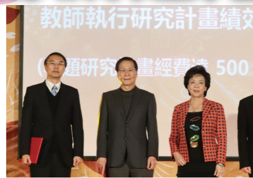
張董事長（右2）頒發「教師執行研究計畫績效卓著獎」。