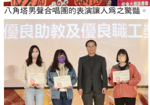
葛校長（右2）頒發「優良助教獎」。