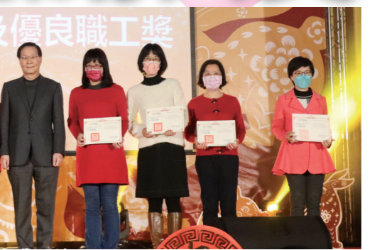
葛校長（左4）頒發「優良職工獎」。