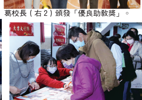
中獎同仁們至服務臺排隊兌獎、領紅包。