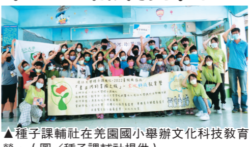
▲種子課輔社在羌園國小舉辦文化科技教育營。