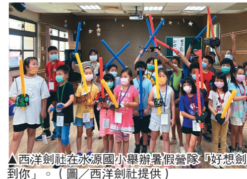
▲西洋劍社在水源國小舉辦暑假營隊「好想劍到你」。