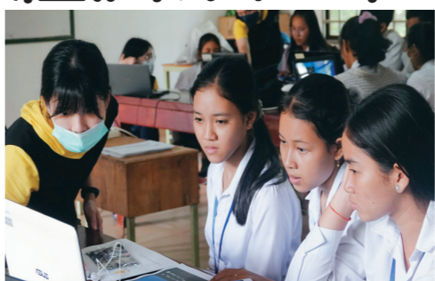
▲「經探號」團隊前往柬埔寨擔任國際志工，指導學生學習數位資訊。