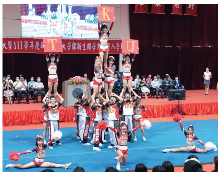
▲競技啦啦隊精彩的表演為開學典禮揭開序幕。