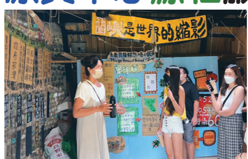
▲原資中心與源社在蘭嶼進行「嶼世無爭」服務學習。