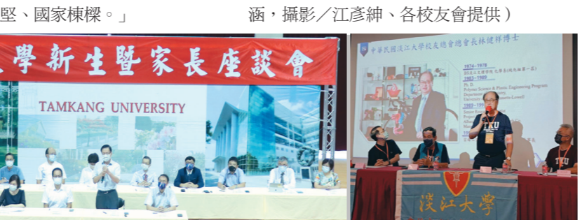
淡江大學新生暨家長座談會