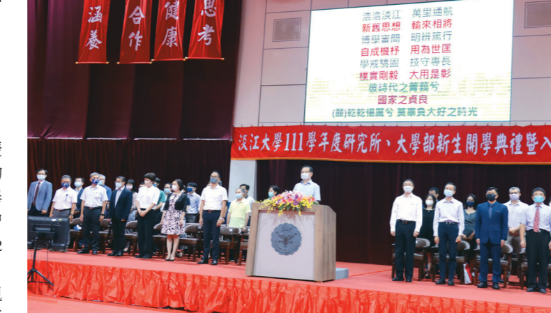
111學年度新生開學典禮暨入學講習在紹謙紀念體育館舉行，葛煥昭校長帶領參與師生齊唱校歌。

【記者姚順富淡江校園報導】歡迎淡江新鮮人！111學年度大學部、研究所新生開學典禮暨入學講習於9月1、2日上午10時在紹謙紀念體育館舉行，由校長葛煥昭主持，學術副校長許輝煌、行政暨副校長林俊宏、國際事務副校長陳小雀、相關教學與行政單位主管，以及新生一同參與，原訂「克難坡巡禮」考量疫情及颱風逼近取消。