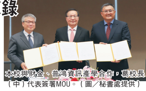
本校與財金、普鴻資訊產學合作，葛校長(中)代表簽署MOU。

三方產學合作除了開設就業課程或專業課程之外，本校將協助聘請優秀人才，提供專業師資，協助兩企業顧問支援與企業診斷、產品開發之專業諮詢，並進行產學合作。兩企業將優先提供本校學生前往國內外所屬機構實習的機會，並協助辦理各類職場實習及企業參訪，不定期舉辦相關領域產學技術研討及媒合活動。