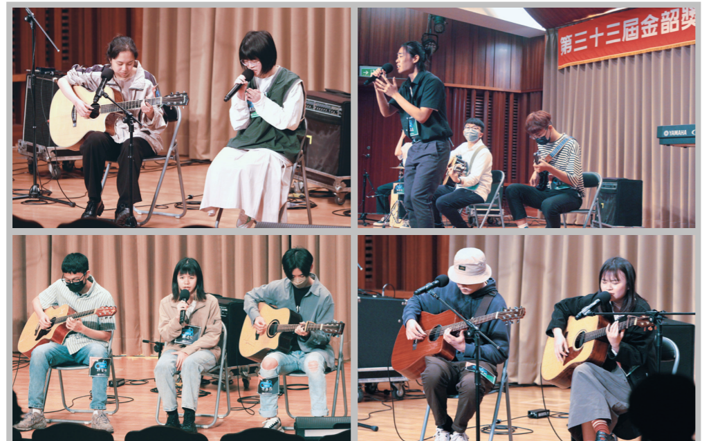
▲第33屆金韶獎初賽4月16日在文鑑音樂廳舉行，參賽者個個卯足全力地展現自己的才華，希望能獲選進入決賽。

【記者陳曉淡水校園報導】由吉他社主辦的年度盛事「第33屆金韶獎創作暨歌唱大賽」於4月16日在文鑑音樂廳進行初賽，現場不開放觀眾入場，採YouTube直播，許多愛好音樂的同好們皆上線參與這場音樂饗宴，當天共計96組參賽，最後選出獨唱7組、重對唱組4組、創作組6組進入決賽。