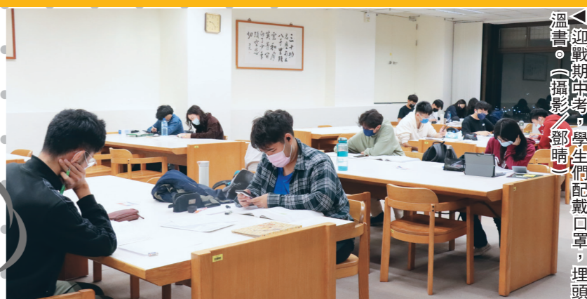
迎戰期中考，學生們配戴口罩，埋頭溫書。