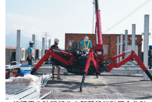
修課學生訪談新北市智慧綠能合作社，到北新醫院參訪太陽能光電板架設過程。

修課學生的回饋中提到，在採訪過程中瞭解到推動綠能已是刻不容緩，在北新醫院採訪太陽能板施工現場時，看到鋼構被吊上來放在屋頂的過程，有著和預想不太一樣的發現，這樣的體驗算是不一樣的收穫。