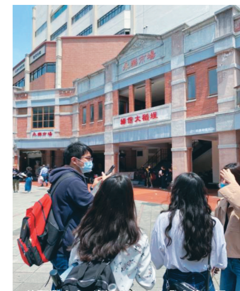
修課學生在了解大稻埕文史內容後，親身現場場勘，利於後續導覽。