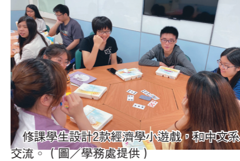
修課學生設計2款經濟學小遊戲，和中文系交流。

課程概要 經濟系教授林彥伶開設「勞動經濟學」課程，於課堂中學習勞動市場基礎運作概念，讓修課學生對勞動市場體系建立專業知識與分析技能，並以實務議題探討，例如就業的相關保障法規、基本工資、勞動歧視、及社會保險與福利等，讓他們能對未來就業時所面臨的法規與政策能有全盤性了解。勞動經濟學是一門現代經濟社會中與人們工作與生活緊密相關的科學，是探討人類生老病死的課程，包括生育率、青少年、教育、就業與失業、勞動市場、婚姻、家庭經濟學、社會保險、退休金、死亡率等各種議題，課堂中除了奠定勞動經濟知識的基礎、了解勞動市場的經濟現象和經濟行為，並使學生透過簡單的學理工具，以解析實際的經濟現象。 本次安排以問卷調查方式了解桃園地區的人口移動、與中文系交流，由中文系分享如何創作兒童繪本，修課學生則設計2款經濟學小遊戲，讓中文系同學了解經濟學原理。透過這樣跨系交流方式，彼此了解學科差異性和專業性以增加跨系合作的機會。修課學生的回饋中提到，透過問卷調查的方式更了解不同地區的移動方式；與中文系交流上能認識到繪本創作的過程，也能透過經濟學小遊戲，讓對方瞭解到經濟學不再只是書本上的死板知識，而是在生活上也隨時隨地感受到並運用在周遭的小常識，透過這些遊戲互動的環節，也能成功的拉進彼此之間的距離。