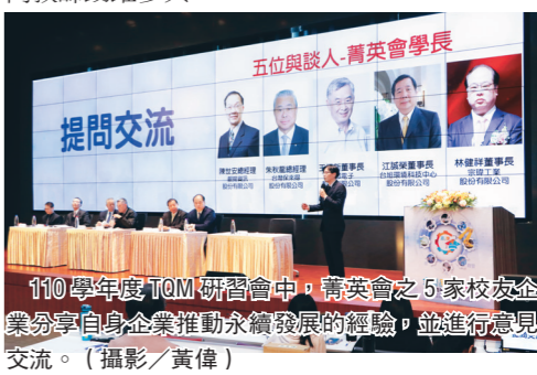
110學年度10M研習會中，青英會之5家校友企業勇於自身企業推動永續發展的經驗，並進行意見交流。