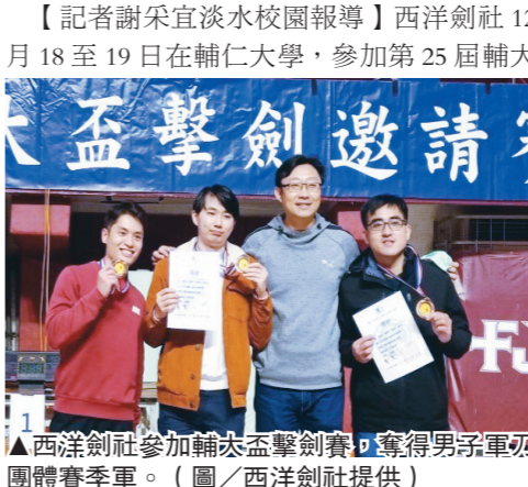
▲西洋劍社參加輔大盃擊劍賽，奪得男子軍刀團體賽銅牌。