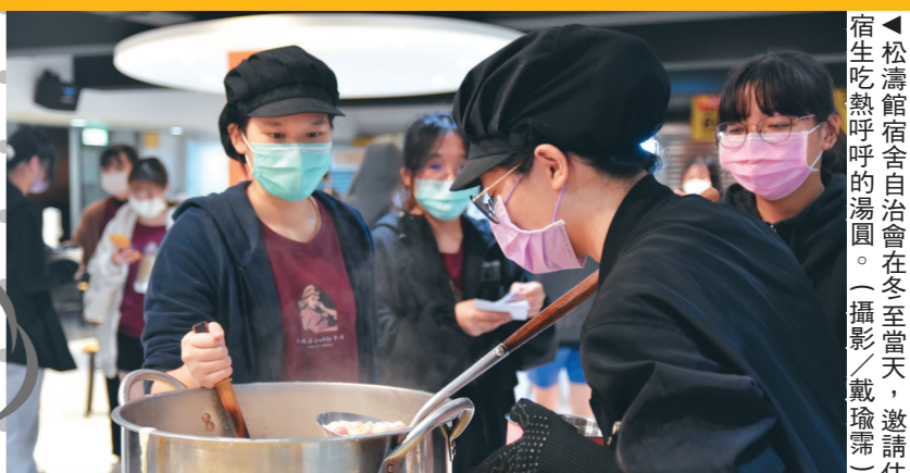
▲松濤宿舍自治會冬至當天，邀請住戶生吃熱呼呼的湯圓。