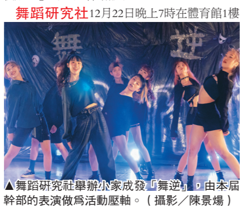
▲舞蹈研究社舉辦「舞逆」，由本屆幹部的表演做為活動壓軸。

題的畫作，伴隨著輕音樂的步調，可以看到油畫、壓克力、水墨畫、水彩、素描等各式作品，展場的擺設區域以色調作分類，色彩相近的作品放在同一區。另一展區則以互動性及大型靜態的作品為主，有自由作畫區、花牆搭配氣球燈及花語說明、自己動手黏乾乾花等，每個作品背後都有不同的意義和故事。 認識長、教科二黃佩婕分享，「我們想用藝術的方式，展示人生中這些精彩時刻及美好的光景，期望這次展覽能帶給觀者正能量與向上的感覺，期許能找到自己心目中獨一無二的綻放。」(文/林靖瑋)