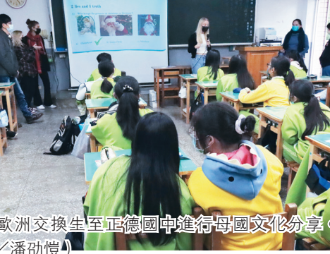
姊妹校歐洲交換生至正德國中進行母國文化分享。

外交部設立「台歐連結獎學金」鼓勵國內大學與歐洲國家大學透過「校對校」方式擴大合作，吸引歐洲學生來臺研習華語及專業課程，並參與大手牽小手至中小學英語教學及文化分享活動，協助推動2030雙語國家計畫。本次與正德國中的合作，國際處共安排14場活動，由來自英、法、德、比、西、匈6國12校32名姊妹校學生到該校歐洲文化社團介紹母國特色，正德國中學生也準備了淡水風情如名勝與小吃的簡介，同時提供一些簡單的中文教學，讓雙方在輕鬆的情況下進行文化和語言交流。