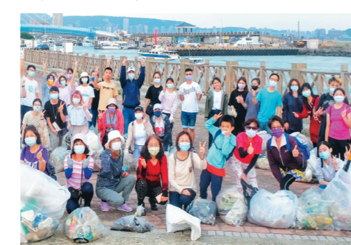
▲慈濟青年服務社10月31日到沙灘淨灘，最終整理超過60袋垃圾。

許多人們丟棄的廢棄物在海中漂流，最後又回到人們居住的土地上，大家應該要少用不環保產品，這樣才能有乾淨的地球讓我們生存。邵心好表示，這是我第二次參加淨灘活動，我認為淨灘活動相當有意義，希望每個人都能盡自己最大的心力愛護地球。(文/陳子涵)