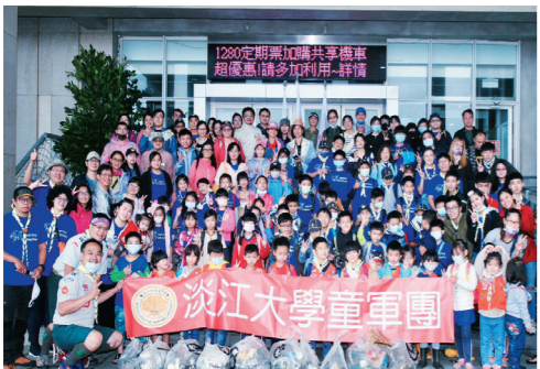
▲淡江大學童軍團10月31日到白沙灣進行淨灘活動。

淡江大學羅浮群、資深女童軍團於10月31日與剛毅童軍文教基金會、台北市環球扶輪青年服務社共同舉辦淨灘活動，吸引逾120位伙伴一同前往新北市白沙灣進行淨灘，共清出10大包垃圾及一些塞不下垃圾袋的海洋垃圾。