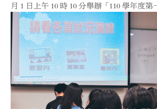
▲全校師生在原上課教室觀看5分鐘的「學生避難疏散示範影片」。