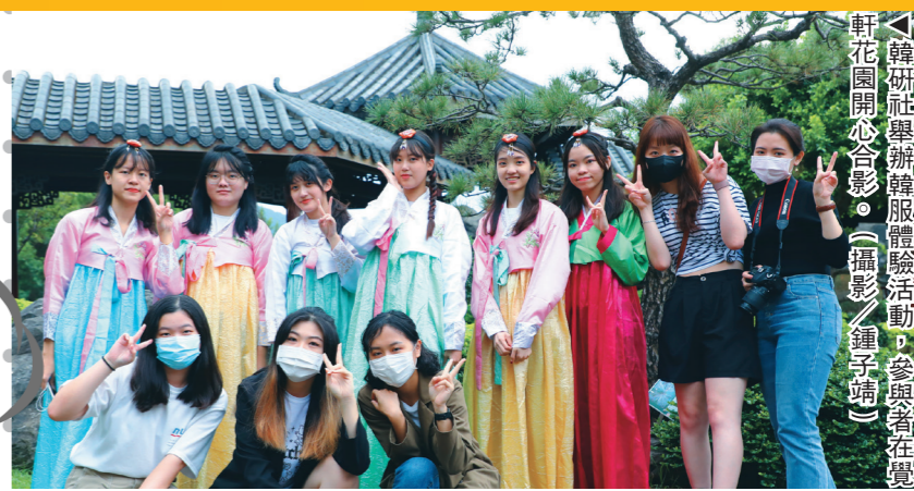
韓研社舉辦韓服體驗活動，參與者在韓花園開心合影。