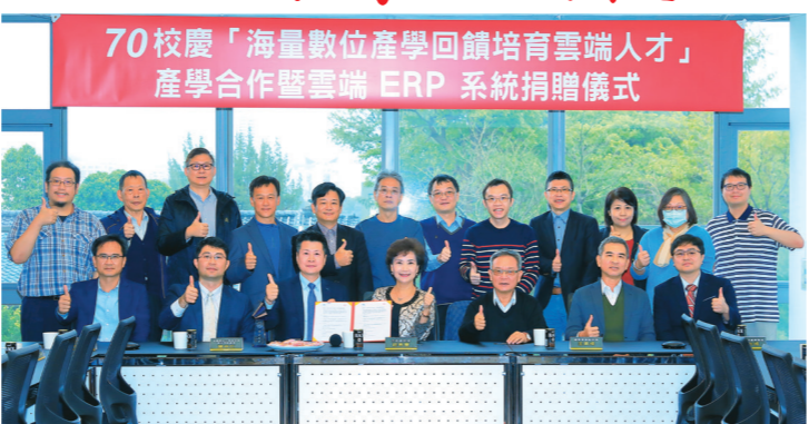
▲12月1日上午在守謙國際會議中心舉行海量數位產學回饋培育雲端人才-產學合作暨雲端ERP系統捐贈儀式。

施中仁50歲時就讀國立中興大學EMBA，開始發展文字雲、製作關係行銷，「當你1位網紅自己開店，遠比告訴3位朋友消息傳得更快，但是我們不能因會員數迷思，產品銷售好壞還是會反映在數據上。」