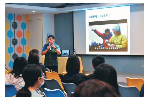
▲體育活動組邀請到臺灣首位攀完世界七大峰的女性登山家江秀真演講。

望終於在2016年的暑假實現了，此「福爾摩沙山城嚮導登山學校」建置於臺中市玉山私立高中，讓山野教育自小就能落實。「行動，就能打開生命視野」是江秀真一直教育給孩子的信念。當困難被打碎之後，成功就能變得簡單！鼓勵學生勇敢執行目標，完成自己的想法。