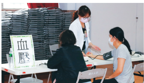
▲護理師幫教職員量測血壓，並給予衛教諮詢及建議。

【記者姜雅馨淡水校園報導】學生事務處衛生保健組為協助本校專任、退休教職員工做好健康自主管理，以期「早期發現、早期治療」，預防疾病發生、規劃健康促進活動等，於11月13日上午8至11時，在學生活動中心舉辦「109學年度教職員工到校健康檢查」，共117位教職員工參與，另提供「109年度季節性流行性感冒疫苗接種」，共計216人施打。 本校補助專任、退休教職員工每2學年1次健康檢查，除可報名在校內進行檢查，也可依規定事先知會衛保組，與本校簽約之健檢機構預約，自行前往健檢。本次活動由恩權醫院到校