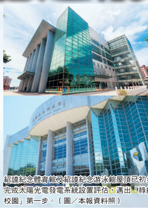
超邁紀念體育館及超邁紀念游泳館屋頂已初步完成太陽光電發電系統設置評估,邁出「綠能校園」第一步。(圖/本報資料照)

針對本校各校園地形與建物進行勘查,「由於淡水校園可建置範圍較大,臺北校園與蘭陽校園可建置的範圍較小,初期將以淡水校園為主。參酌相關需求及效益後,將優先評估五虎崗機車停車場建置可行性,同時亦評估體育館與游泳館屋頂作為示範區之可行性。」