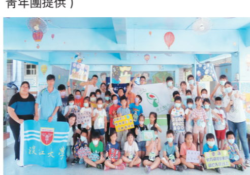
▲種子課輔社於7月20日至23日在屏東縣佳冬鄉光園國小舉辦品格教育營