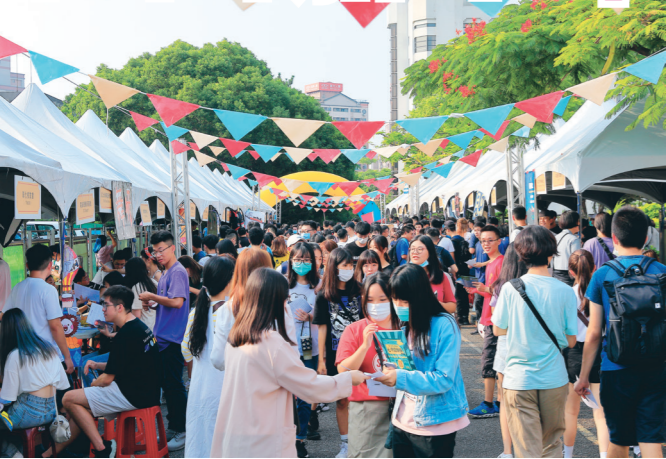
▲社團招生博覽會於海報街擺攤招生，各社團向學生介紹社團特色。

【記者游曉彤淡水校園報導】由課外活動輔導組舉辦的社團博覽會於9月10日起為期7天，在海報街進行擺攤招生，共邀請105個社團參與，同時也會在學生會的攤位上發放小禮物，歡迎大家前往免費領取。