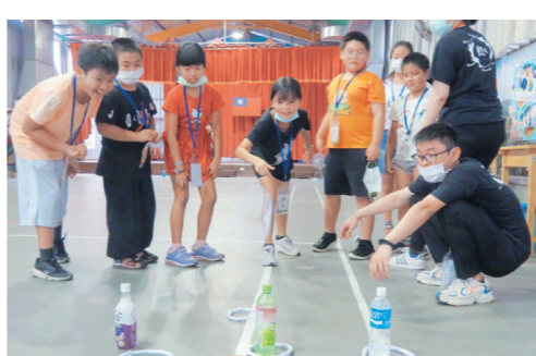
▲模毅青年團於7月17日至19日在新北市淡水區育英國小進行品格成長營活動