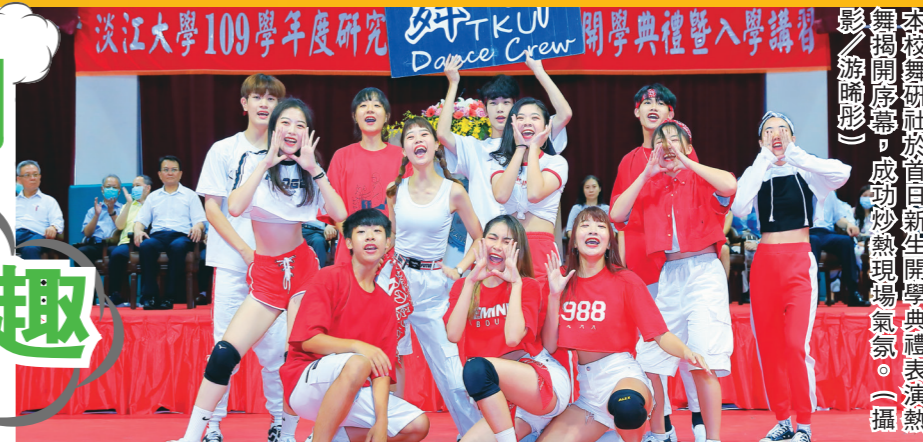
淡江大學109學年度研究舞研迎新開學典禮暨入學講習會開幕，成功炒熱現場氣氛。