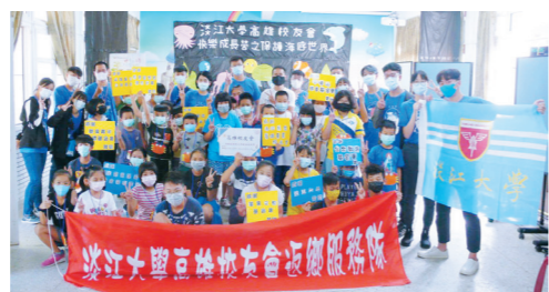
▲高雄校友會於7月20日至23日在高雄市六龜區寶來國小舉辦「快樂成長營之保護海底世界」

經濟學系於8月4日至6日在淡江大學舉辦經探號探索營「七原罪之亂」，吸引60名來自全國各地的中高中生參與，以往的經探號名為暑期探索營和柬埔寨服務學習團，本次因疫情影響取消柬埔寨服務活動。三天兩夜的營隊活動，目的為讓高中生了解大學的經濟學內