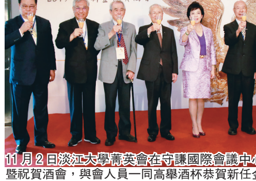
11月2日淡江大學菁英會在守謙國際會議中心HC405舉行迎新暨祝賀酒會，與會人員一同高舉酒杯恭賀新任金鷹校友。