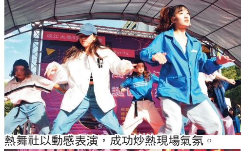
熱舞社以動感表演，成功炒熱現場氣氛。