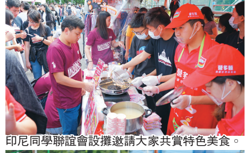
印尼同學聯誼會設攤邀請大家共賞特色美食。