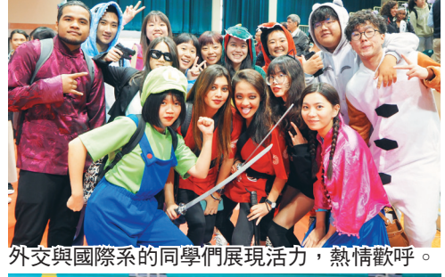
外交與國際系的同學們展現活力，熱情歡呼。