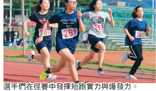
選手們在徑賽中發揮短跑實力與爆發力。