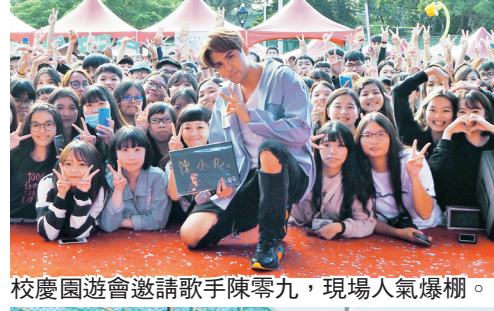
校園園遊會邀請歌手陳零九，現場人氣爆棚。