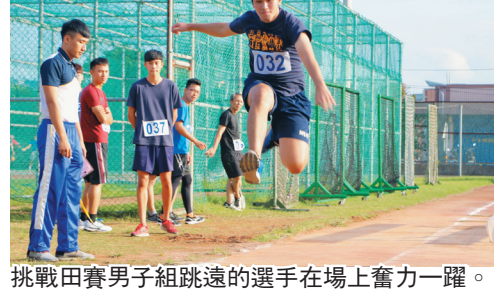
挑戰田賽男子組跳遠的選手在場上奮力一躍。