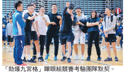
「勁爆九宮格」睜眼組競賽考驗團隊默契。