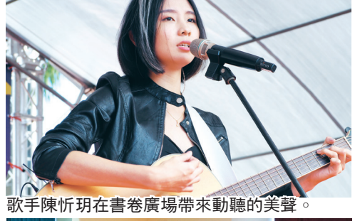
歌手陳忻玥在書卷廣場帶來動聽的美聲。