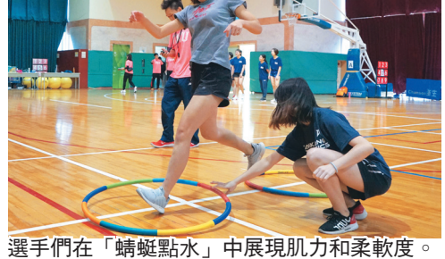
選手們在「蜻蜓點水」中展現肌力和柔軟度。