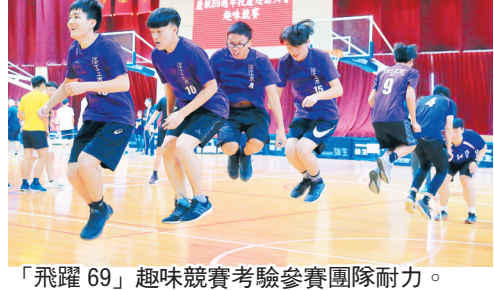
「飛躍69」趣味競賽考驗參賽團隊耐力。