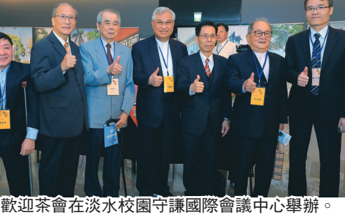
今年校友返校歡迎茶會在淡水校園守謙國際會議中心舉辦。