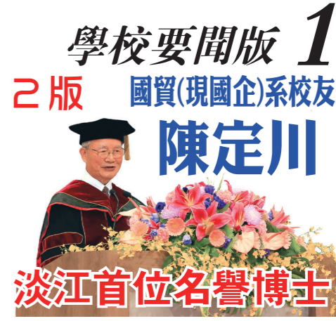
淡江首位名譽博士