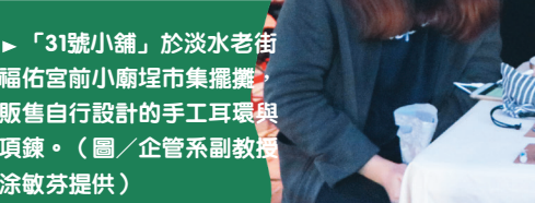
▲「31號小舖」於淡水老街福佑前小廟埕市集擺攤販售自行設計的手工耳環與項鍊。

該課程統計至今，共計有15國學生參與原住民部落服務，透過服務也開啓在地原住民孩童的國際視野，也是本校國際化具體展現，是服務學習課程開設10年以來最多國家文化接觸的課程。 本堂課程應用的是戲劇治療理論，「戲劇治療」是1990年以來在休閒遊憩治療領域的發展趨勢，主要是以有意義、系統化地運用演說詮釋的歷程，促成個人與團體心靈的成長及改變；並結合劇場中的角色、故事、肢體語言等表達方式，鼓勵修課學生探索生命議題後，自發性地探討自我生命的傷痛經驗，藉此療癒自我身心靈健康發展，希望能激發潛能與建立積極的人生觀，以應用於觀光產業中策展、會展旅遊等活動實務。 在實作上，從前往部落規劃聖誕劇的演出過程中，邀請劇團導演至少6小時的戲劇工作坊、引導學生認識及運用身體語言，更親自參與製作道具、服裝、化妝、造型、攝錄影等工作，藉此豐富教學情境，也讓修課學生藉此深入了解泰雅族原鄉族人的文化、地方特色與生活樣貌；而聖誕劇的排練、製作、展演更是受到學生最大迴響，同時當日部落中老中青幼四代觀眾熱烈的回饋也讓學生們感受到付出與收穫的美好。