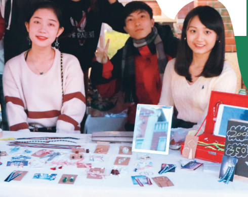
▲「31號小舖」於淡水老街福佑前小廟埕市集擺攤販售自行設計的手工耳環與項鍊。

涂敏芬表示，透過這堂課希望學生可以收穫3個禮物，「一是擁有具有想像力的心智，在擺攤服務專案中，對學生而言都是從零開始，我擔任專案經理角色負責管理進度，讓他們必須從自行發想產品、採買原料、打造原型、經營粉絲團、攤位設計和叫賣、公開策展等實務經營，這些都需要他們不設限的想像力；二是可以工作的雙手，這不只是交報告就可以結束的課程，在不只一個攤位需要商品中，透過「教」與「學」的關係中，老師教過後然後學生學到了，再透過動手做而進行微型計畫，來證明自己真的學會；三是可以愛人的心，分組的過程多少會意見不合，也可能會對課堂安排有所不滿，但藉此幫助學生學習包容和傾聽組員的意見，並讓他們了解創意的基礎是「愛」，愛自己的產品、愛自己的夥伴、愛自己所規劃和執行的工作，甚至愛這門課程等等，這樣就能感受到這一切都是有意義且溫暖的。」