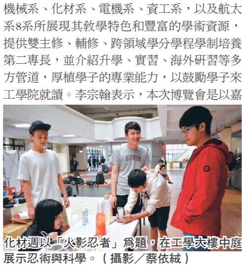
化材週以「火影忍者」為題，在工學大樓中庭展示忍術與科學。

【記者楊惠晴淡水校園報導】本校工學院於5月4日在守謙國際會議中心舉辦工學院系所聯合博覽會，邀請即將成為工學院之淡江新鮮人和家長一同前來本校，了解院內8系所的學系特色，工學院院長李宗翰說明，透過這次博覽會形式，邀集院內建築系、土木系、水環系、機械系、化材系、電機系、資工系，以及航大系8系所展現其教學特色和豐富的學術資源，提供雙主修、輔修、跨領域學分學程學制培養第二專長，並介紹升學、實習、海外研習等多方管道，厚植學生的專業能力，以鼓勵學子來工學院就讀。李宗翰表示，本次博覽會是以嘉年華形式呈現，從學系優勢深入專業的課程設計中，讓學生掌握大數據、雲端運算、人工智慧、物聯網等全球趨勢，希望讓學子和家長都能了解本院能滿足學生的專業需求，是最適性發展的最佳選擇。李宗翰指出，工學院配合南向政策前進越南等進行海外招生宣傳。