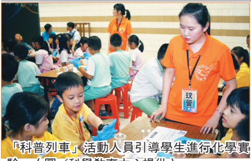
「科普列車」活動人員引導學生進行化學實驗。