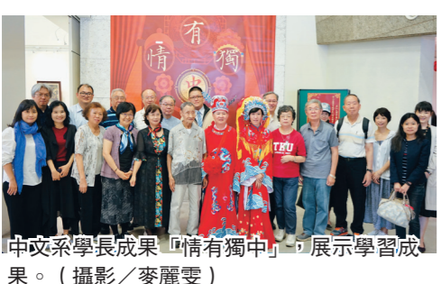
中文系學長成果「情有獨中」展示學習成果。

本校科教團隊與陳錫煌掌中劇團，以經典名著「西遊記」當中的金角大王與銀角大王為原型，設計了一場跨領域的化學科普實驗表演。由臺灣國寶級大師陳錫煌親自上陣，操作布袋戲偶完成化學實驗。現場觀眾看得目不轉睛，不時拿起手機，捕捉戲偶端起容器倒入化學藥品的精彩畫面。科教團隊也將板橋站出口廣場改造為化學實驗室，帶領同學與民眾操作化學實驗，將各藥品加入指定溶液當中，除了觀察顏色變化，也能看到緩緩長出珊瑚般的「海底花園」。