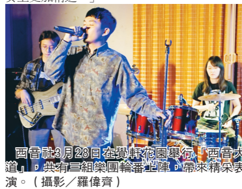
西音社 3 月 28 日在覺軒花園舉行「西音大道」，共有 3 組樂團輪番開唱，帶來精采表演。

觀眾、財經二施皓元表示，「西音大道是給喜歡音樂的人一個表現的舞臺。看完學弟們的表演，覺得他們很有潛力，期待他們未來在演奏上更加精進。」