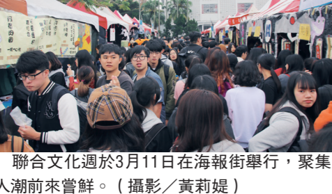
聯合文化週於3月11日在海報街舉行，聚集人潮前來賞鮮。（攝影/黃莉媿）