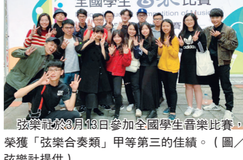
弦樂社於3月13日參加全國學生音樂比賽，榮獲「弦樂合奏類」甲等第三的佳績。