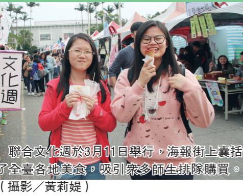
聯合文化週於3月11日舉行，海報街上囊括了全臺各地美食，吸引眾多師生排隊購買。