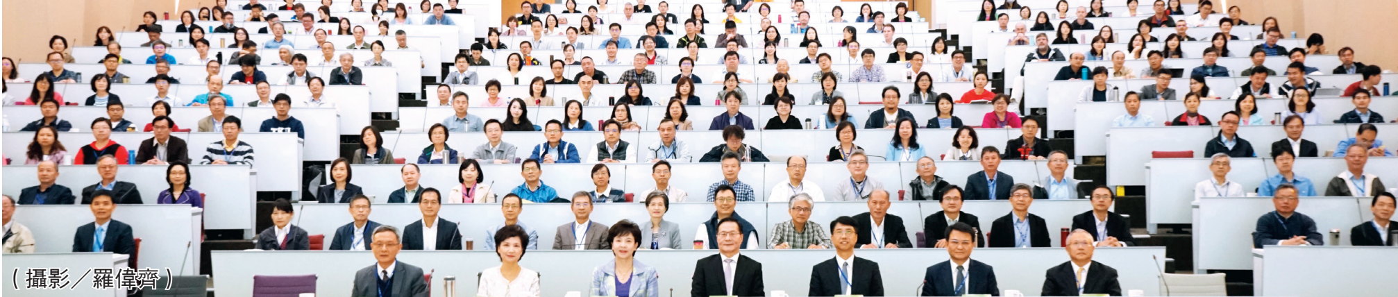
淡江第五波研討會開幕典禮。