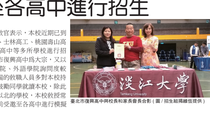
臺北市復興高中與校長和家長會合影

【記者林雨荷淡水校園報導】本校招生組於5月受邀至各個高中參加高中職升學博覽會，現場除了準備本校系簡介文宣、進修班招生文宣之外，也解答了高中生對大學的疑惑。