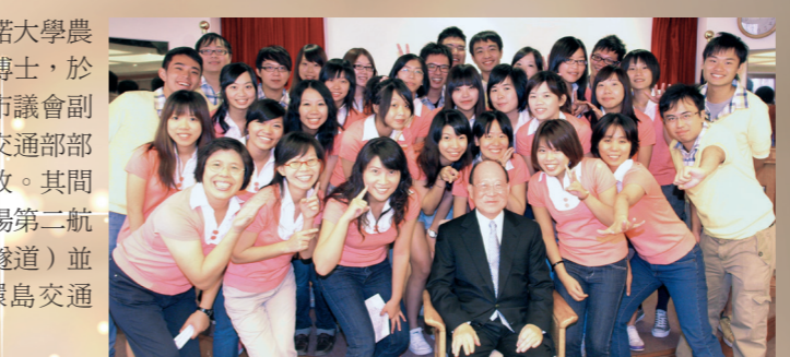
張創辦人於本報舉辦學生記者研習活動時，均出席勉勵學生。

張創辦人，宜蘭羅東人，畢業於上海聖約翰大學經濟系，美國伊利諾大學農業經濟碩士、教育行政學博士，於1969年至1989年擔任臺北市議會副議長、議長，1989年出任交通部部長，1997年出任總統府資政。其間籌建北二高、桃園國際機場第二航站及北宜高速公路(雪山隧道)並舉劃高鐵路完成臺灣環島交通網。