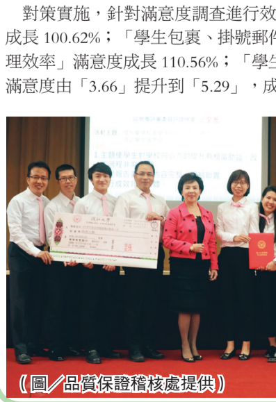
(圖／品質保證稽核處提供)