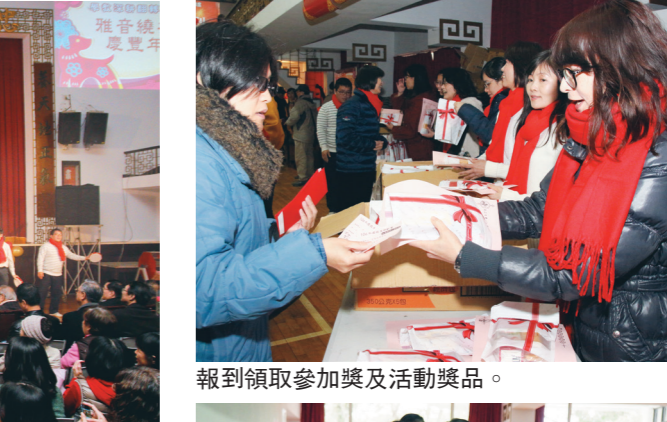
報到領取參加獎及活動獎品。