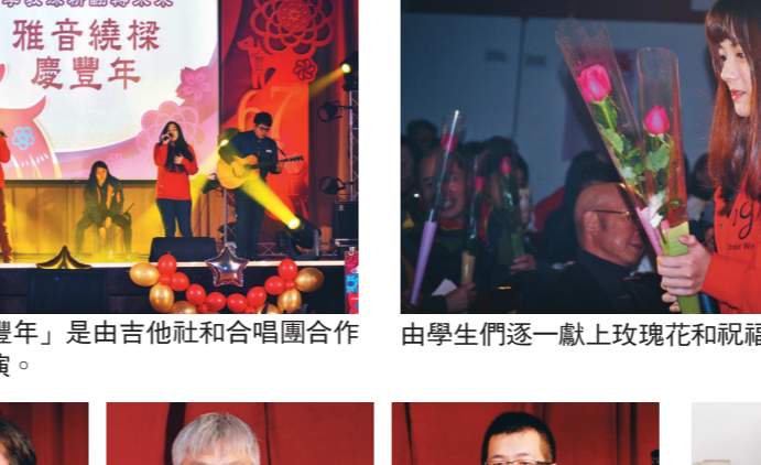
「雅音繞樑慶豐年」是由吉他和合唱團合作帶來動聽的表演。