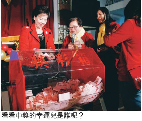
看看中獎的幸運兒是誰呢？