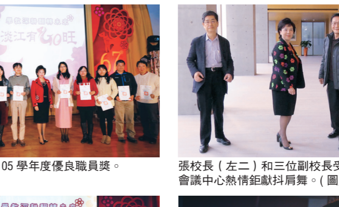
現場公開表揚105學年度優良職員獎。