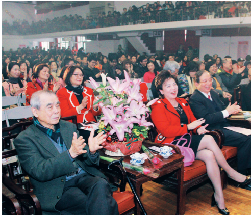
臺上熱鬧、逗趣表演贏得全場掌聲。