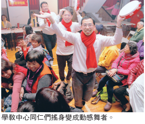
學教中心同仁們搖身變成動感舞者。