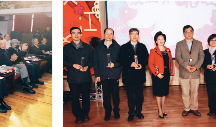
會中表揚教師專題研究計畫經費達500萬元以上，以資鼓勵。