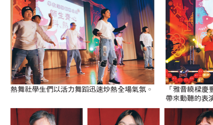
熱舞社學生們以活力舞蹈迅速炒熱全場氣氛。