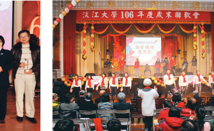
學教中心同仁們協同社團同學卯足全力表演，博得滿堂彩。