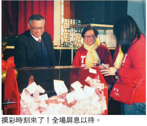
摸彩時刻來了！全場屏息以待。