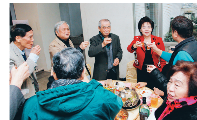
張校長逐桌和退休的資深人員們敬酒。