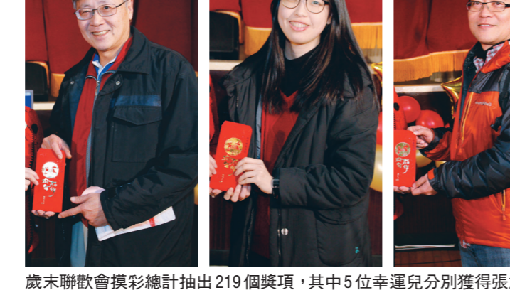
歲末聯歡會摸彩總計抽出219個獎項，其中5位幸運兒分別獲得張創辦人獎、姜名譽董事長獎、張董事長獎及校長獎等大獎。