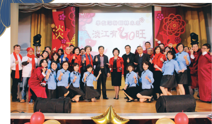
今年由學教中心以「學教深耕翻轉未來，淡江有GO旺」為題，準備精采演出和全校教職員工及退休人員同歡。