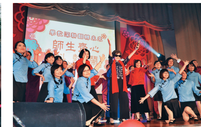
動感十足的師生齊心「抖」「熱」鬧，贏得全場熱烈掌聲與迴響。