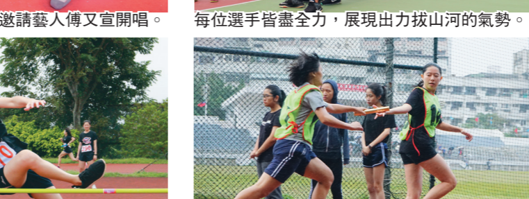
選手助跑、奮力起跳，騰空過桿，完美落地。