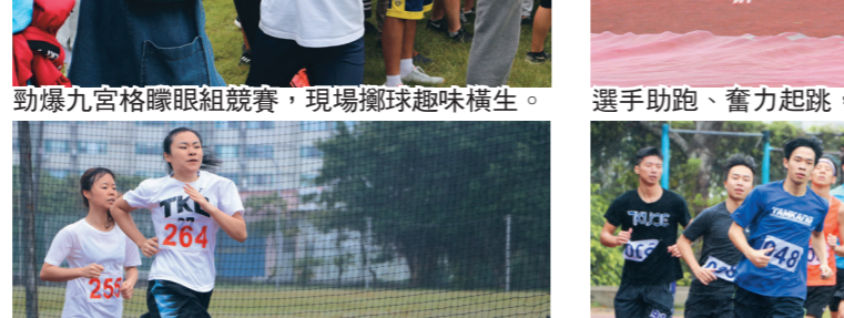
即使天色灰濛濛，選手們依然卯足全力衝刺！