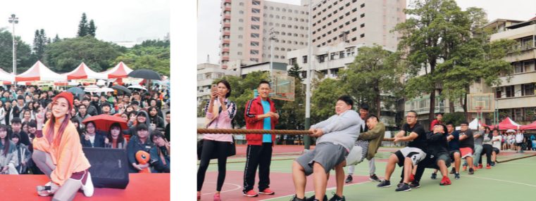
美聲蛋捲 - 校園演唱會邀請藝人傅又宣開唱。