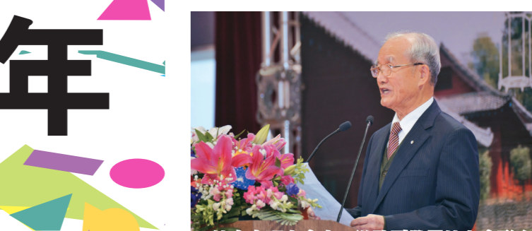
67 校慶慶祝大會中，邀請到世界校友會聯合會總會會長陳定川致詞。