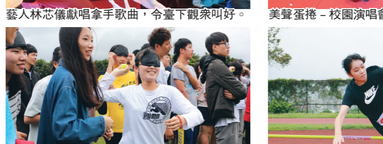
動爆九宮格眼組競賽，現場擲球趣味橫生。