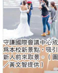
守謙國際會議中心成為本校新景點，吸引新人前來取景。