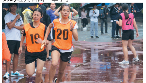
選手們在風雨中拼盡全力、奔向終點線。