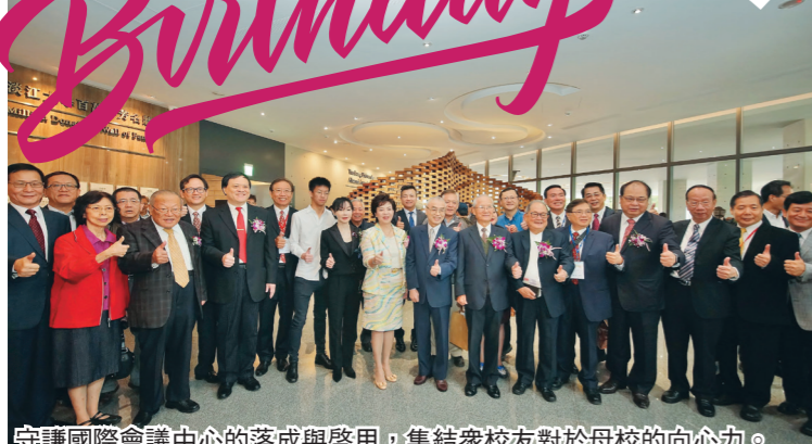
守謙國際會議中心的落成與啟用，集結眾校友對於母校的向心力。

【本報訊】淡江大學創校 67 週年校慶，精彩活動不間斷！本期特別企劃，精彩回顧 4 日校慶慶祝大會、守謙國際會議中心落成啟用典禮、守謙國際會議中心興建記揭幕、同舟廣場啟用暨慶祝茶會、校友返校聯誼餐會、蛋捲馬戲團校園遊園會，以及 8 日舉辦的 67 週年校慶運動大會等系列活动，特別是社團展演的活力、運動健兒的身影及趣味競賽的畫面，藉由影像再次躍然紙上，為祝賀淡江大學生日快樂寫下完美的一頁。