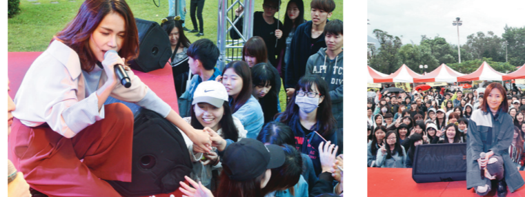
藝人林芯儀獻唱拿手歌曲，令臺下觀眾叫好。