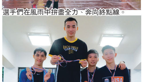
獲獎的選手們站上頒獎臺，開心合影留念。