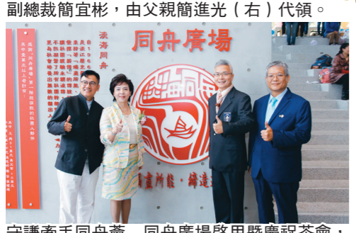
守謙牽手同舟會 - 同舟廣場啟用暨慶祝茶會，邀請社團人返校團聚。