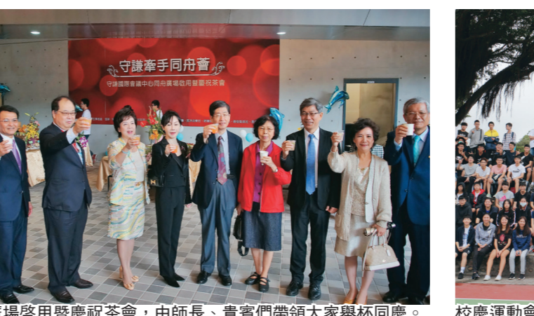
同舟廣場啟用暨慶祝茶會，由師長、貴賓們帶領大家舉杯同慶。