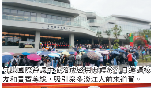
守謙國際會議中心落成啟用典禮於 4 日邀請校友和貴賓剪綵，吸引眾多淡江人前來道賀。