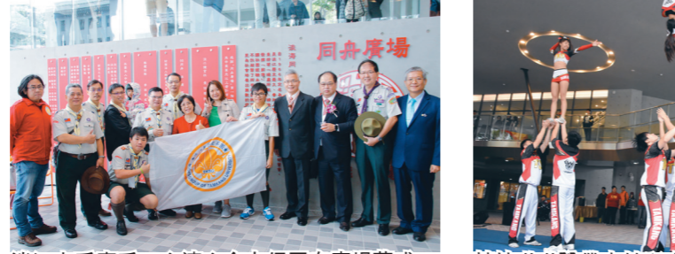
淡江人手牽手、心連心合力促同舟廣場落成。