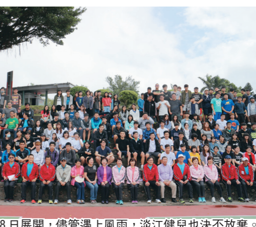
校慶運動會 8 日展開，儘管遇上風雨，淡江健兒也決不放棄。