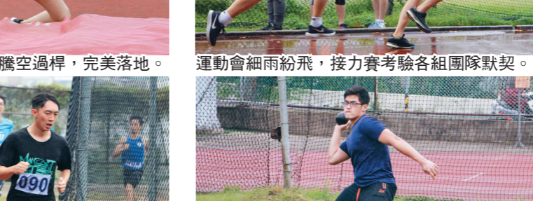
風雨生信心！選手們皆堅持完賽，決不放棄。