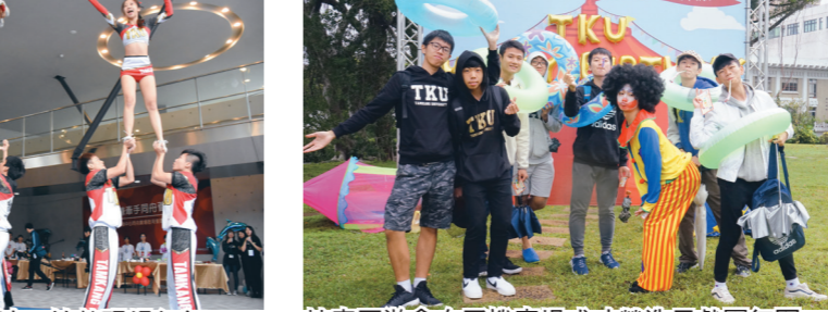
競技啦啦隊帶來精彩表演，炒熱現場氣氛。