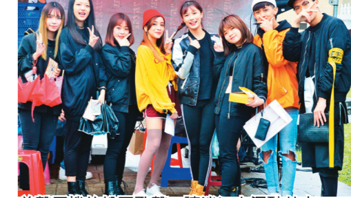
美聲蛋捲的悅耳歌聲，讓淡江人沉醉其中。