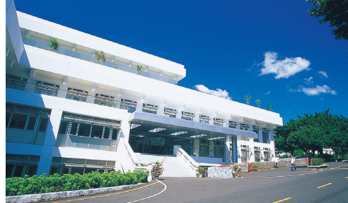
▲1999年，鍾靈化學館整新啟用。

化學館於1957年開始興建，其後歷經數次擴建，目前有地下一層、地上6層，主要用途作為教室、化學實驗室、研究室、圖書館使用，除了配備有精密儀器，2、3樓設有化學專業電子化圖書館及化學教學實驗室，新館的落成促使理學院之教學研究邁入新紀元，亦為本校學術聲望開創卓越的領先地位。