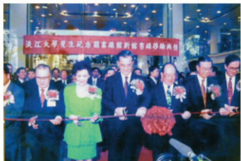
▲1996年，創辦人張建邦(右三)、時任副總統兼行政院長連戰(右四)、時任考試院院長許水德(左一)等人為本校新建之全國第一座電子化、數位化的覺生紀念圖書館落成剪綵。

1996年，覺生紀念圖書館落成，前棟9層樓高，作為圖書館使用，以全日開放成為引領大學圖書館的新趨勢；後棟11層樓高，提供教室、教育發展中心使用，10樓則為覺生國際會議廳。圖書館規劃以「資訊化」為目標，網際網路之設置可供1,400位使用者同時上線，為全國首創，當年啓論典禮邀請到前副總統連戰蒞校，並與創辦人張建邦伉儷一同合影。