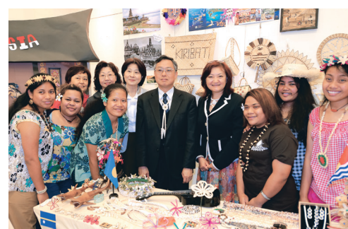
▲2003年，本校獲得「92年度優質英語生活環境評審獎勵」特優獎肯定。圖為師生在境外生國家文物展中合影。

2004年，欣逢本校54週年校慶，本校創辦人張建邦定調為「奠定成功基礎的保證年」，為即將邁進第四波，奠定了紹謨紀念體育館、外語大樓與蘭陽校舍等基礎重大工程。張創辦人更以「邁進淡江第四波」為題，在本報第561期專文中表示，「2005年蘭陽校園開始招生為淡江重新定位的第四波新起點，也是淡江重新開闢第二條S形曲線(The Sigmoid Curve)的開始。淡江應智慧的運用現有的人力、物力並爆發潛力，以及發揮淡江的歷史傳承與文化特性，加四倍努力拓展優勢，使淡江早日成為國內外學術重鎮之一。」