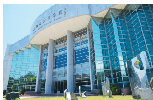
▲2002年，紹謨紀念游泳館落成。(圖/本報資料照片)

紹謨紀念游泳館6層樓高，聳立於克難坡之巔，正面為玻璃帷幕，可遠眺淡海晨曦，晚照盡入眼底。泳池設於4樓，池長50公尺、寬18公尺、8水道，設備現代化、擁有殘障入水之