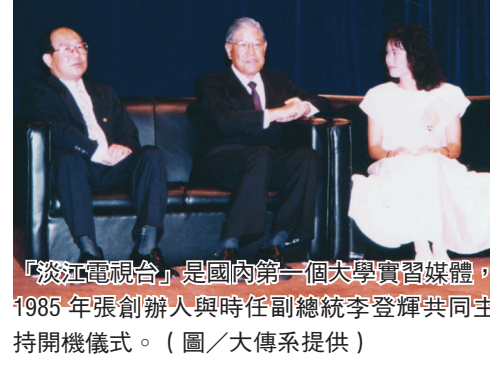
「淡江電視台」是國內第一個大學實習媒體，1985年張創辦人與時任副總統李登輝共同主持開機儀式。

麗澤學舍不僅象徵台日雙方學術交流活動邁入成熟階段，同時也是本校自1968年拓展國際學術交流工作，與本校締結姊妹校已達197所，遍及歐、亞、美、非洲及大洋洲，為展現深耕國際化交出一張相當亮眼的成績單。