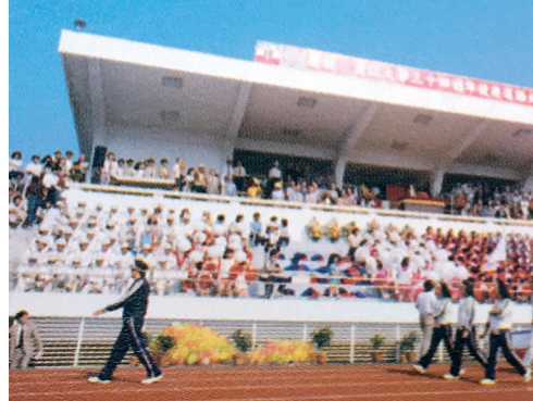
▲1984年，新建體育場啟用，並在校慶當日舉辦全校運動會。（圖／取自《淡江影像60》）

1989年，由日本麗澤大學出資、本校捐地興建的「麗澤學舍」竣工，提供麗澤大學留學生和本校日文系同學住宿，與「麗澤班」第三屆畢業及第八梯次開學典禮，一同舉行落成典禮。當年適逢本校與麗澤大學締結姊妹校10週年，特別在會文館舉辦慶祝酒會。