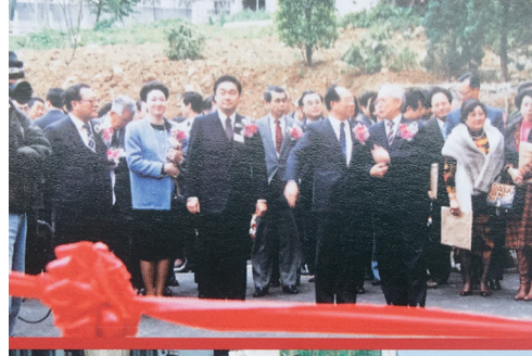
▲1989年，麗澤學舍竣工啟用，與「麗澤班」第三屆畢業及第八梯次開學典禮，一同舉行落成典禮。

1989年，由日本麗澤大學出資、本校捐地興建的「麗澤學舍」竣工，提供麗澤大學留學生和本校日文系同學住宿，與「麗澤班」第三屆畢業及第八梯次開學典禮，一同舉行落成典禮。當年適逢本校與麗澤大學締結姊妹校10週年，特別在會文館舉辦慶祝酒會。