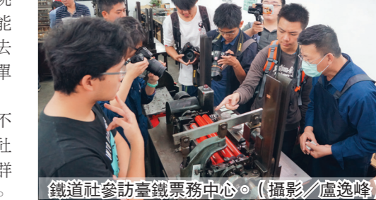
鐵道社參訪臺鐵業務中心。

【記者盧逸峰淡水校園報導】鐵道社於6日前往位於中壢的臺灣鐵路管理局業務中心進行參訪，在資深老師傅的帶領下，一窺車票的製作流程，並觀看傳統印刷機、紙本切割機、活字版印刷機等實際操作情形，讓一行17人大開眼界。