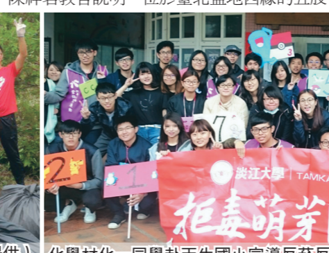
化學材化一同學赴天生國小宣導反菸反毒。