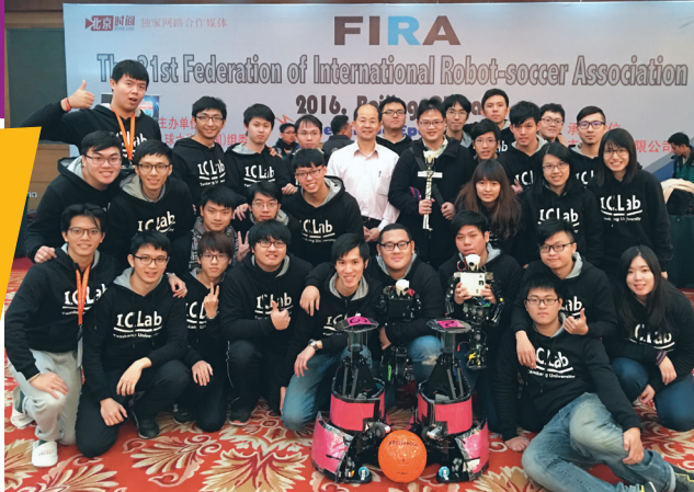
▲本校機器人研究團隊於去年底赴北京參加「第 21 屆 2016 FIRA 世界盃機器人足球賽」，贏得 4 金 1 銀 3 銅佳績。