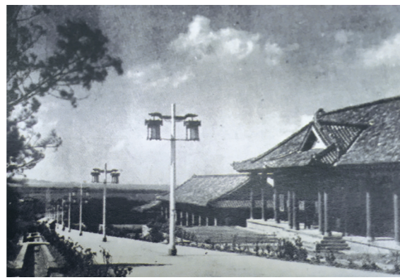
▲1955年，宮燈教室啟用，在此處上課幾乎是所有淡江人的回憶。

本校是全臺第一所私立高等學府，1950年創校至今，重視「國際化、資訊化、未來化」三化教育，歷經奠基、定位、提升與轉變四個階段，筆路藍縷，力爭上游，逾一甲子的耕耘，始終與國家社會的發展緊密相繫，與高等教育的變革息息相關，是一所培育具心靈卓越的人才之綜合大學。 高等教育面對少子女化的衝擊與全球化的激烈競爭，本校厚植資源、用心治校。今年，隨著「守謙國際會議中心」落成，即將邁入第五波，開放全校師生參與思考未來發展願景的同時，本報製作系列報導回顧第一波到第四波歷史的傳承與階段建設，並前瞻第五波。