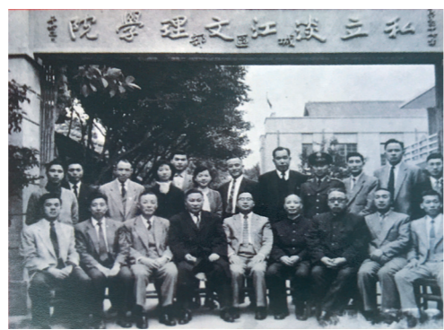
▲1958年，由英語專科學校改制為淡江文理學院。

1953年是本校的轉折點，由於淡江英專辦學受到國家肯定，淡水鎮贈送永久校舍基地，正是現今校址；1957年「英專路」鋪築完成，即是通往學校的重要道路，著名的132階梯「克難坡」也矗立眼前，現今依舊能感受草創時期的艱辛，以及一步一腳印的堅毅精神。