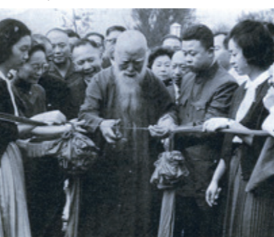
▲1962年，本校牧羊橋落成，中華民國第一任監察院院長、書法家于右任蒞校剪綵。

1962年，學生活動中心落成，淡江文理學院適逢十二週年院慶，時任監察院院長于右任蒞臨本校，也為牧羊橋的落成進行剪綵。《淡江週刊》第148號報導，前任董事長張居瀛說：「島勉全院師生百尺竿頭，更求進步，對社會各界熱心教育人士給予本院的協助表示謝忱，對學生活動中心將於院慶日舉行落成典禮而感欣慰。」