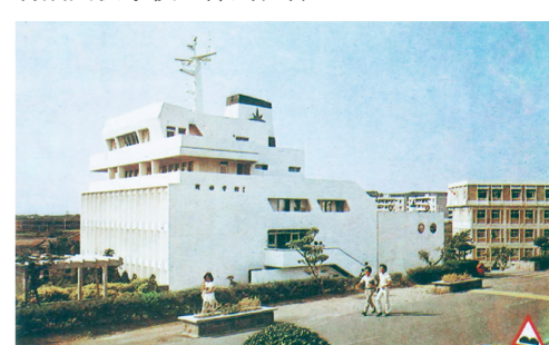
▲1978年，本校商船學館啟用，現為海事博物館。

本校於1976、1977年創立航海系、輪機系，專門培育航海、輪機科技人才。當時長榮集團創辦人張榮發捐資興建「商船學館」，並捐贈各項有關航海、輪機之教學設備，後因國家教育政策的變更，停止招收學生，於1989年歡送最後一屆學生後，擊劃為「海事博物館」，免費開放各界參觀，持續推動海事教育，並將教育觸角從學校延伸到社會。