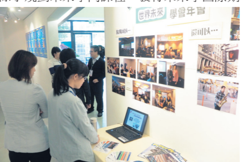
▲未來學所於2015年在黑天鵝展示廳舉辦「未來週」系列活動，包括實習發表會、世界未來學會心得分享及「預見未來」系列工作坊，吸引眾多師生前往觀展。