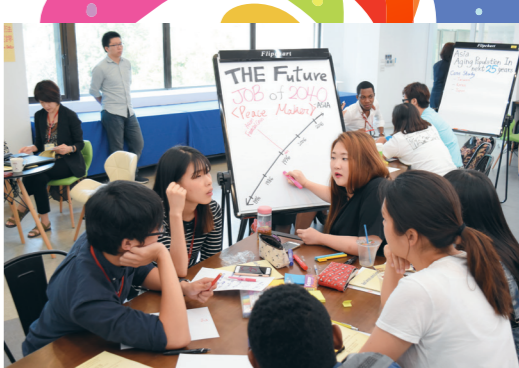
▲本校於2015年在I201設立「洞悉未來情境教室」，並命名為「iF.Room」，「i」有imagination (想像力)、innovation (創新) 涵義，「F」則象徵Future (未來)...