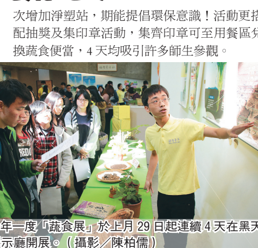
一年一度「蔬食展」於上月 29 日起連續 4 天在鵝鑾展示廳開展。

【記者周怡霏淡水校園報導】食用蔬菜能為身體及環境帶來什麼好處？福智青年社舉辦的一年一度「蔬食展」於上月 29 日起連續 4 天在鵝鑾展示廳開展，為大眾解說蔬食功能。開幕式邀請校長張家宜、社團指導老師土木系教授吳朝賢、教務長鄭東文、學務長林俊宏等師長共同剪綵。張校長致詞表示，福智青年社推動蔬食活動已長達 9 年，這是有有意義的活動，希望日後能繼續推廣蔬食！現場設有有機站、綠保站、蔬食站、食品站及淨塑站，每站均設解說員導覽。社長管科二張劭華表示，推廣有機蔬食能讓身體更健康，更能保護大地，此外這