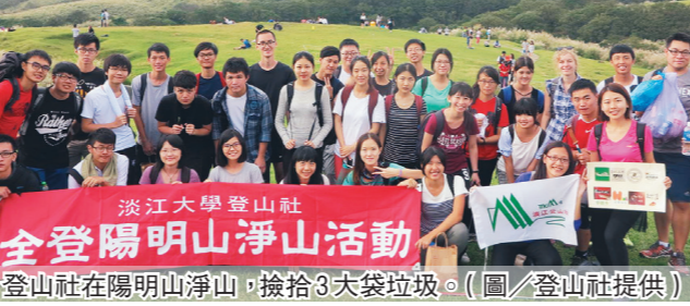
淡江大學登山社全登陽明山淨山活動，登山社在陽明山淨山，撿拾 3 大袋垃圾。

【記者趙世勳淡水校園報導】熱血傳愛心！童軍團、校園獅子會與運管系系學會合作舉辦「校園熱血獅計畫」，捐血車將於 11 月 1 日（週二）至 3 日一連 3 天，早上 10 時 30 分至下午 6 時進駐海街與商館大樓。 若成功捐血一袋，即可獲抽獎券，獎品有自拍器、廣角鏡頭等；成功捐血兩袋則可獲隨身碟；若為首次捐血者，另有福袋獎勵。羅澤群群長公行二陳柏豪表示，「禮物十分豐富，歡迎大家響應光臨 66，燦爛 99 的捐血活動。」他提醒欲捐血者，務必攜帶證件。 氣球社 飛鏢社 追球目標迎新 【記者簡妙如淡水校園報導】25 日氣球社與飛鏢社在校外舉行「追球目標」聯合迎新，吸引約 40 名社員參與。 氣球社社長歷史四簡子涵認為，平常社課是加強氣球技巧，不太有增進感情的活動，聯合迎新就是讓社員更融入社團。飛鏢社社長資圖二李育備則分享，設計遊戲時，特別將飛鏢的規則娛樂化，希望參與的同學都能玩得盡興。 活動規劃 3 道關卡的闖關活動，展現飛鏢社的技術與發揮氣球社的創意。資圖二陳奕軒表示，「很開心認識了平時社課沒有交流的社員，也與氣球社社員們互動良好。遊戲最後一關融合兩社特色，我認為是成功之處。」